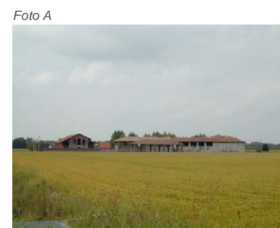
Vista complessiva da est.