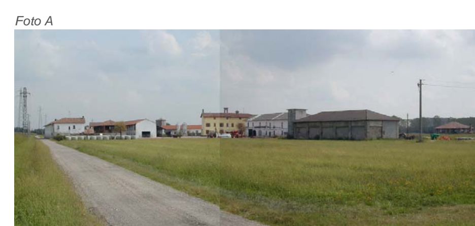
Vista complessiva da ovest.