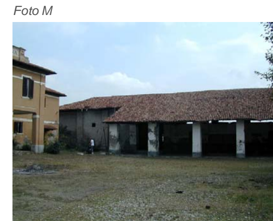
Edifici 9 - 10.