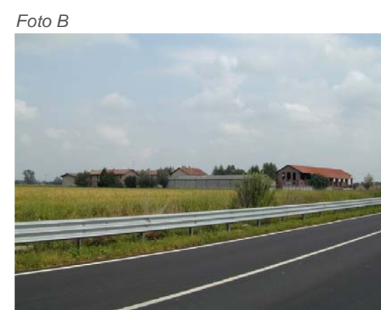
Vista complessiva da sud-ovest.