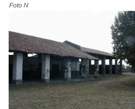
Edifici 10 e 11.