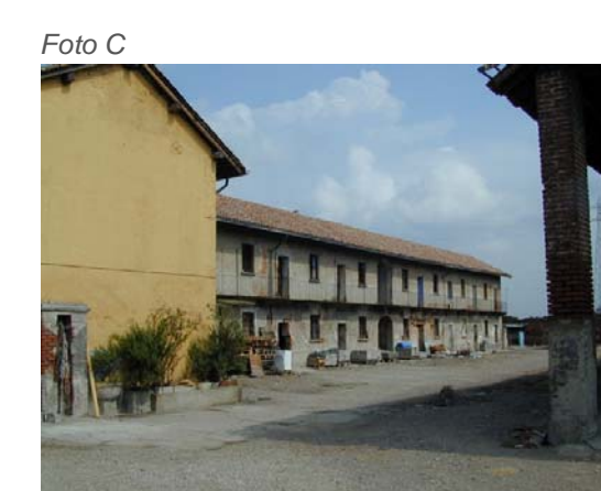
Edifici 3 e 4.