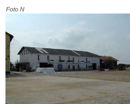
Edifici 13 - 14.