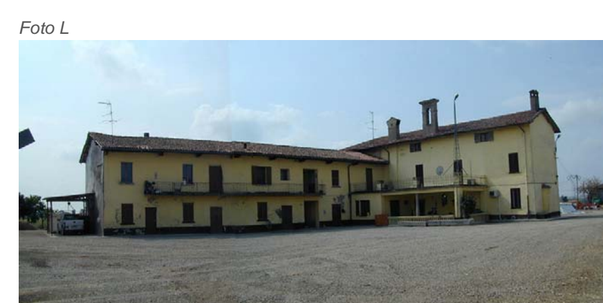
Edificio 10 - 11.