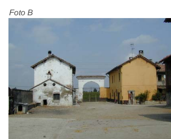
Edifici 1 e 3 e manufatto 2.