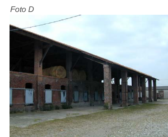
Edificio 1 (sullo sfondo il 12).