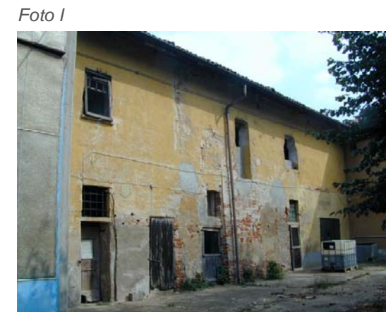
Edificio 7 (con parte del 6 a sx).