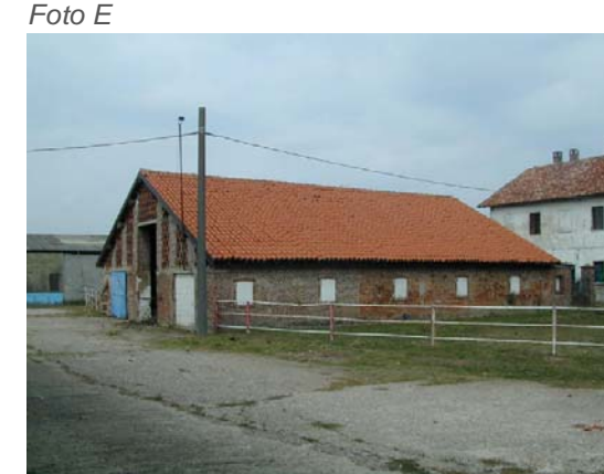
Edificio 2 (sullo sfondo il 12 a sx e il 4 a dx).