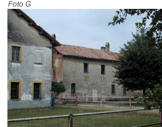
Edifici 4 e 5.