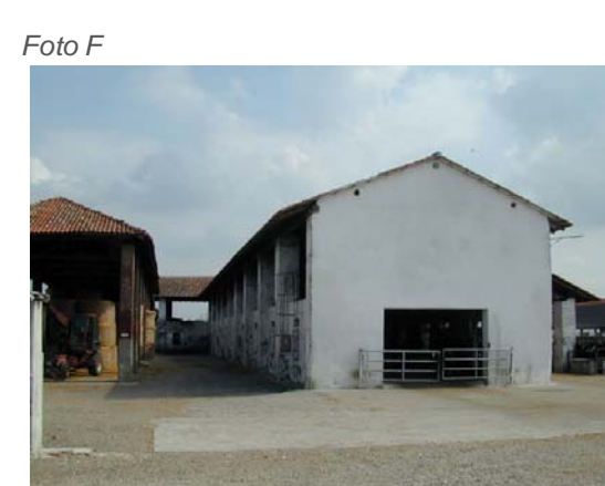
Edifici 6 e 8.