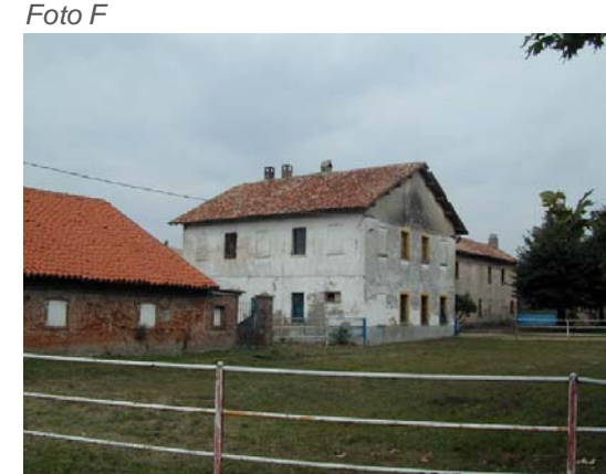
Edificio 4 (col 2 a sx e il 5 a dx).