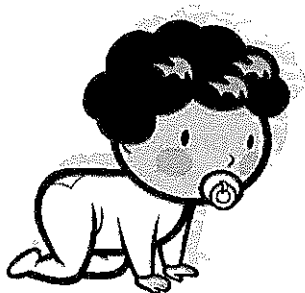
Illustrazione della giornata tipo all'interno del nido