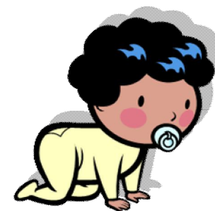
Illustrazione della giornata tipo all'interno del nido

Ricordarsi di contrassegnare tutto il corredo e gli indumenti del bambino.